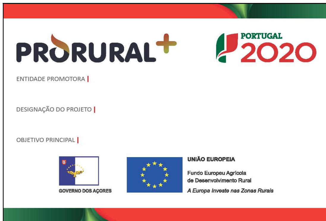
Modelo 1 (Formato A3 42cm x 29,7cm – versão horizontal)

O beneficiário deve fixar, durante a execução da operação de investimento, uma placa de dimensão mínima A3 colocada na zona de entrada do edifício e de forma bem visível pelo público e que realce o apoio financeiro da União – Modelo 1, sendo opcional a orientação horizontal ou vertical.