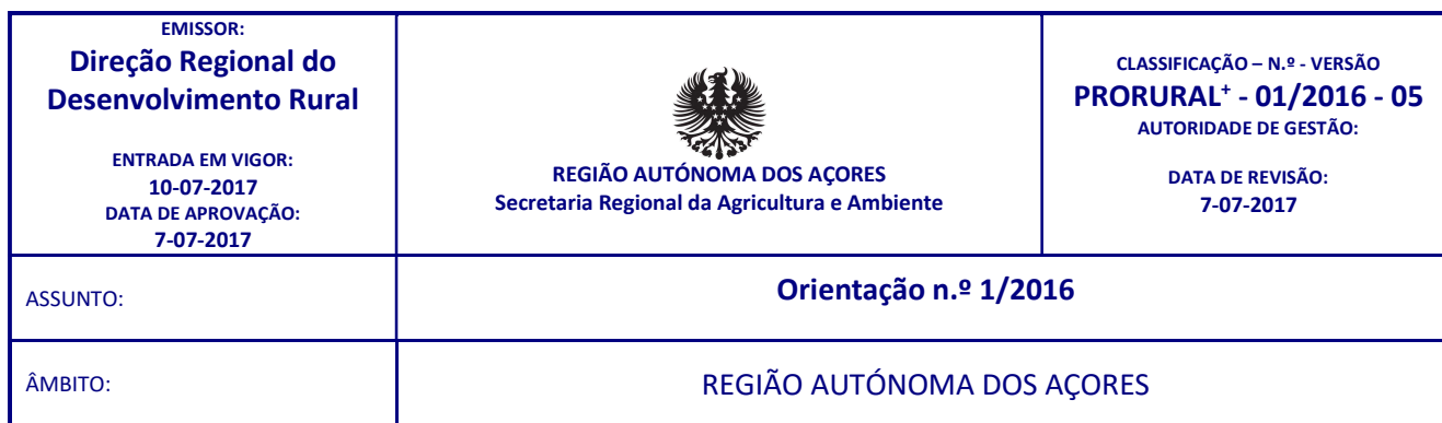
Modelo 1 (Formato A3 29,7cm x 42cm – versão vertical)